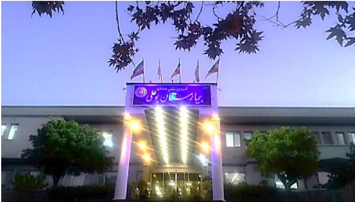
نمای کنونی بیمارستان بوعلی همدان